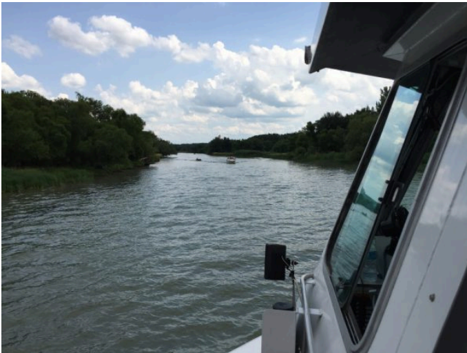
À bord du bateau de croisière.

Malheureusement, aucun héron en vue alors qu'on peut compter jusqu'à 5000 nids dans le secteur! On se contente donc d'envoyer la main aux quelques villégiateurs assis sur les galeries de leurs chalets sur pilotis.