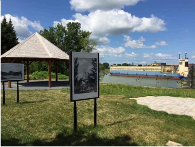
L'exposition extérieure gratuite «Souvenirs 67».

Au parc Regard-sur-le-Fleuve, on peut voir différents lieux de Sorel-Tracy photographiés de nuit par les membres du Club photo Sorel-Tracy.