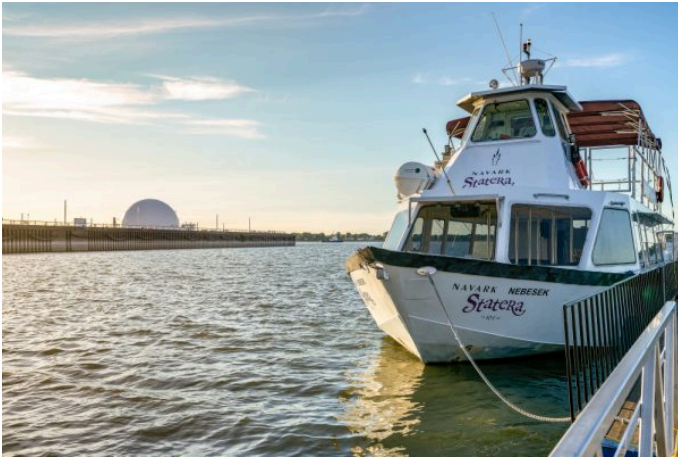
À bord de ce bateau, on navigue sur des chenaux qui ont parfois des airs de bayous.

Ce périple sur un bateau à deux-ponts dure trois heures. On navigue sur des chenaux qui ont parfois des airs de bayous. On se faufile entre des îles aux noms évocateurs: l'île aux Fantômes, aux Raisins, d'Embarras, aux Sables... La guide nous renseigne sur la variété des espèces qu'on y trouve.