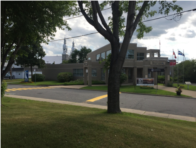
Le Biophare présente une exposition fascinante.

Prenez le temps de visiter les deux autres expositions à l'affiche; elles illustrent la richesse du patrimoine culturel et économique de Sorel-Tracy. Pendre le large raconte la formidable contribution des frères Simard au développement de la ville. Leurs entreprises, notamment Marine Industries, ont fait travailler des milliers de personnes et rayonner la ville à travers le monde. Plusieurs navires de guerre ont été construits dans les chantiers navals de Sorel durant les années 1940. Des bateaux de croisière aussi, ces fameux bateaux blancs de la Canada Steamship Lines qui sillonnaient le fleuve, le Richelieu et le Saguenay. Ce que je ne savais pas, c'est qu'avant de décliner, les usines de Sorel ont connu un sursaut grâce à la fabrication de wagons-citernes.