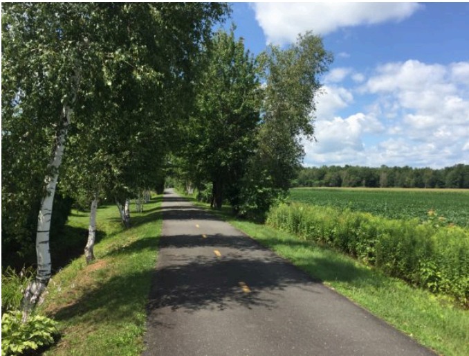
On peut faire de belles randonnées en vélo à Sorel-Tracy.

Statera n'est pas le seul atout de Sorel-Tracy. On peut y prolonger son séjour pour faire de belles randonnées en vélo. Il y en a pour tous les types de cyclistes. La piste La Sauvagine , facile et pas trop longue, promet une belle excursion en famille. On peut la prendre à partir de la Maison des gouverneurs , qui est aussi le bureau d'information touristique de la région. En passant, c'est dans cette maison que, le 25 décembre 1781, un sapin a été illuminé pour la première fois au Canada.