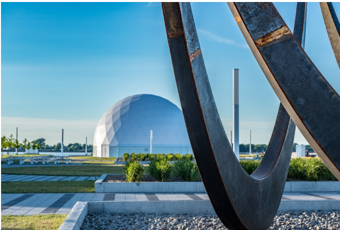
C'est sur un vaste terrain récupéré du fédéral que les visiteurs trouveront trois des quatre volets de l'expérience Statera .

Et pour ce qui est de la 104 e île, c'est Statera , ce lieu d'équilibre entre l'industrie, toujours présente à Sorel, et la nature abondante et généreuse qui se trouve au milieu du fleuve.